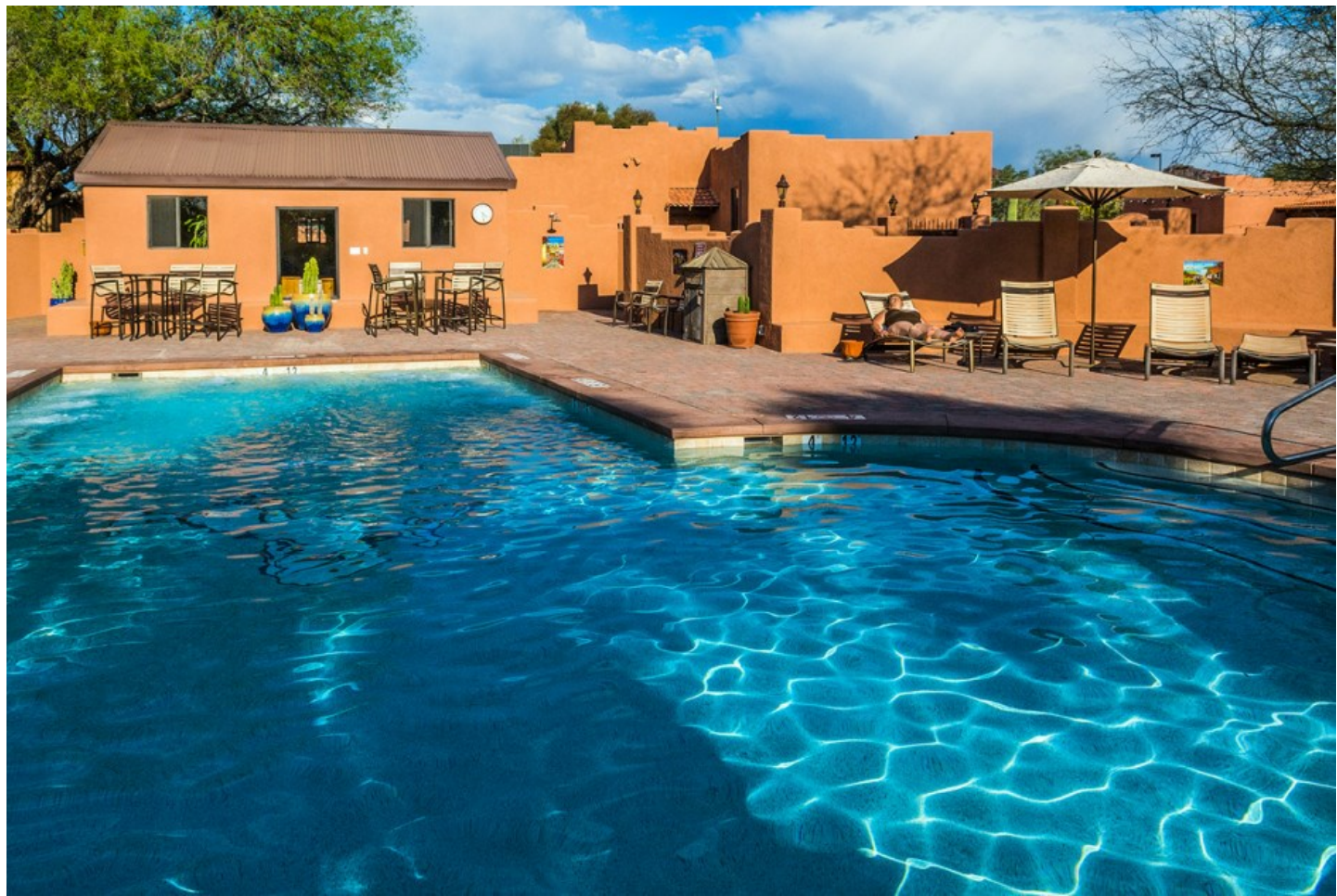
Arizona | Saguaro NP

Hier finden Sie den perfekten Mix zwischen Aktivitäten an der frischen Luft und Entspannung.